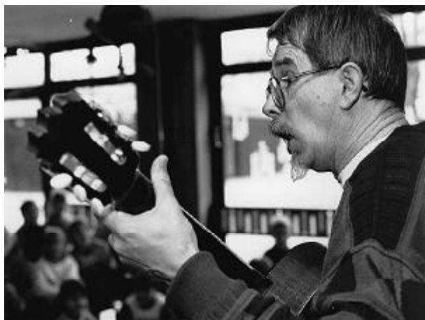
Kinder und Eltern wollen die Lehrerinnen und Lehrer kennenlernen.

So war es nun an uns, die Begrüßung mit unseren eigenen Talenten und unserem Lehrerhandwerk zu gestalten. Da stellte sich heraus, daß zwei Kolleginnen Kinder und Eltern mit einer Vier-Rollen-Geschichte fesseln konnten, vorgelesen mit Stabmasken. Stimmung und Zustimmung erzeugte auch der Kollege, der zur Gitarre ein Mitsingelied zum besten gab.