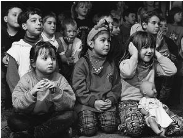
Wir können sie nicht "in Reih und Glied" unterrichten.

Zwecklos, sie zu beklagen, die vielfältigen "Unterschiede" zwischen den Kindern. Ihre Verschiedenheiten sollten uns freuen. Zeigen sie uns doch die Größe und Schönheit unserer Aufgabe. Da sind 23 kleine, eigenwillige Personen. Mit Wissen und Können, mit Fragen und Ängsten, mit Phantasie und Neugier. Mit dem Wunsch nach unserer Nähe in der noch neuen Umgebung.